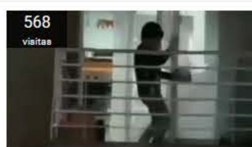
Niño se vuelve viral en las redes sociales por su enérgica forma de protesta durante cacerolazo