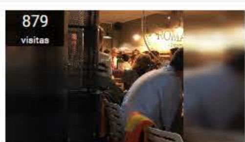
"Chile se quema y él come pizza": medio italiano critica a Piñera por ir a cumpleaños durante crisis