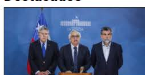
Gobierno confirma 2 muertos y 3 heridos graves tras jornada de violencia: "Lo lamentamos"