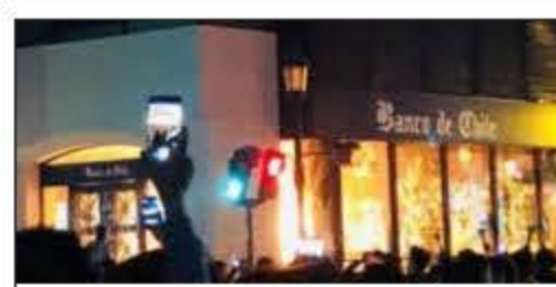
Incendian bancos, servicios públicos y AFP's durante disturbios en principales ciudades de Chile