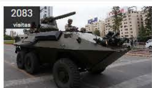
Oficiales de Armada en retiro ofrecen alistarse: "Solo se puede actuar imponiendo el orden"