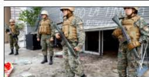
Especial de Cadem: un 53% respalda estado de emergencia tras jornadas de violencia